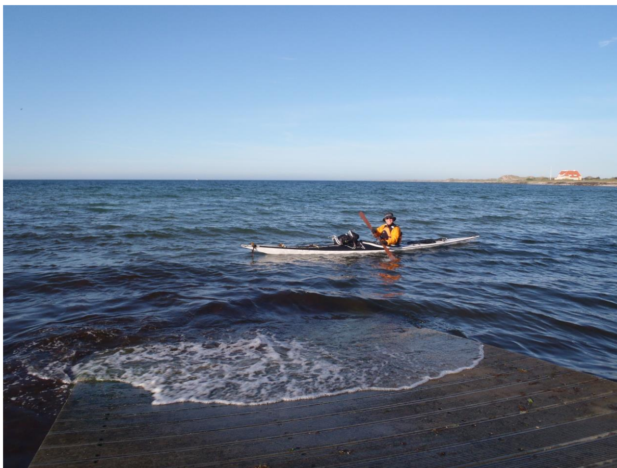
Der lægges fra land ved Skagen Havkajakklubs slæbested